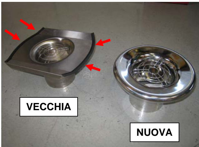
Design della vecchia cappa rispetto a quella nuova

Il design della cappa in acciaio inox dei bracci di aspirazione KOMSA è stato migliorato. La ragione di questa modifica è stata principalmente quella di liberarsi dei bordi affilati presenti sull'attuale cappa e conseguentemente di eliminare la necessità dei parabordi (vedi frecce rosse).